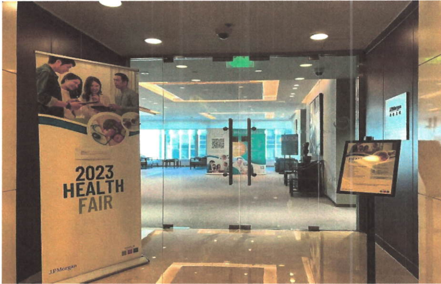
图八：员工健康线上知识讲座