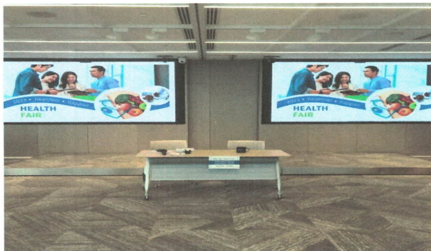
图七：举办健康展会（北京）