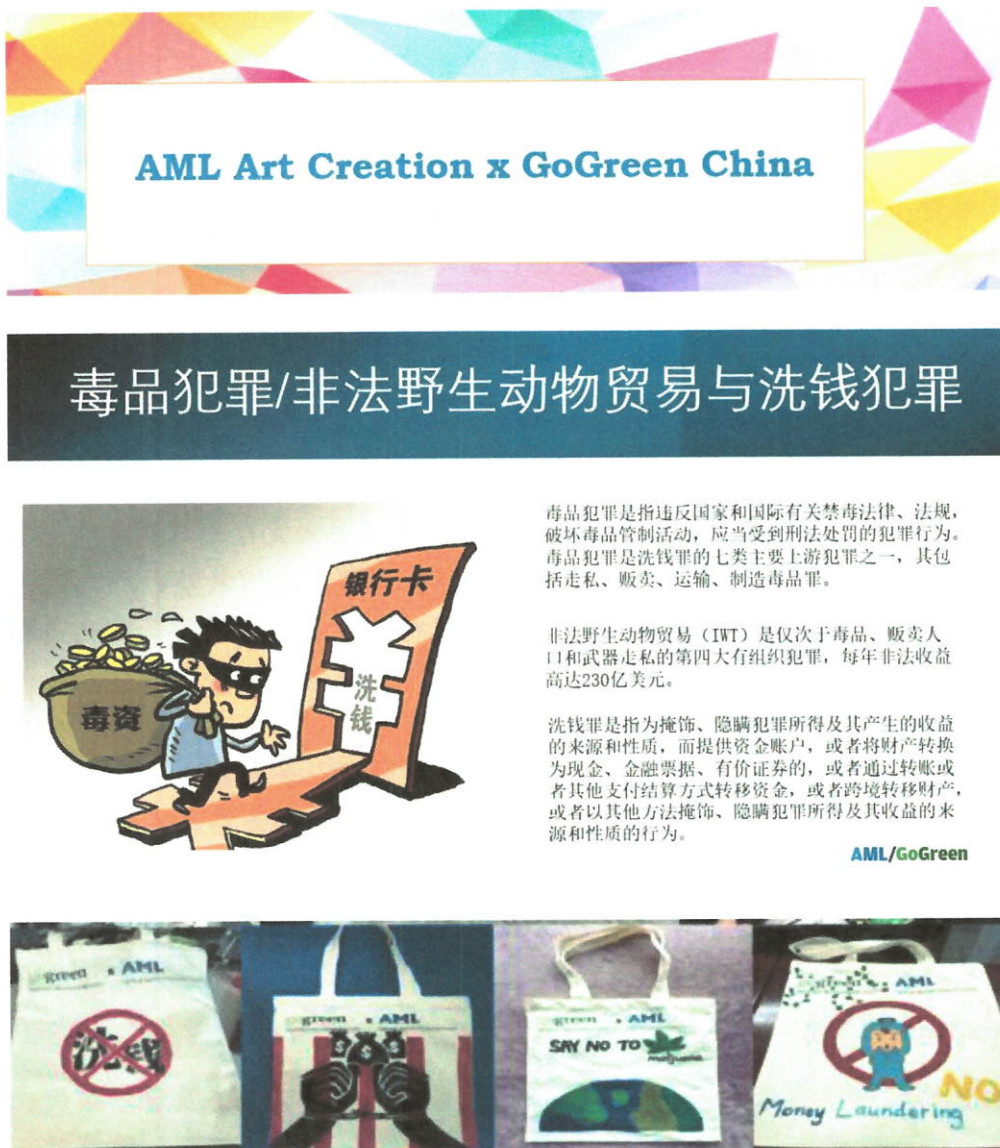
图一：反洗钱趣味性艺术创作活动和部分作品展示

为提升公司员工对反洗钱工作重要性的认识，公司于 2023 年 8 月举办了以“守住钱袋子，护好幸福家”为主题的“反洗钱宣传月”活动，结合扫黑除恶、反恐、反腐、禁毒、保护账户安全、打击地下钱庄和非法集资、打击电信网络诈骗和网络赌博等主题，采取了线上和线下的活动方式，共计举办了四场大型反洗钱特色宣传活动。活动内容包括：“反洗钱知多少”，“反洗钱追缉令”，反洗钱趣味性艺术创作，以及“反洗钱线上知识答答看”知识竞赛。以上反洗钱宣传活动获得了各个职能部门和业务条线员工的积极参与和热烈反响，共计 235 人次参与。此外，公司还于 2023 年 11 月 3 日在官网的投资者教育页面，上传了题为《反洗钱宣传：防范非法集资 预防洗钱犯罪》的反洗钱教育文章，供投资者和社会公众阅读，以增强公众的反洗钱意识。