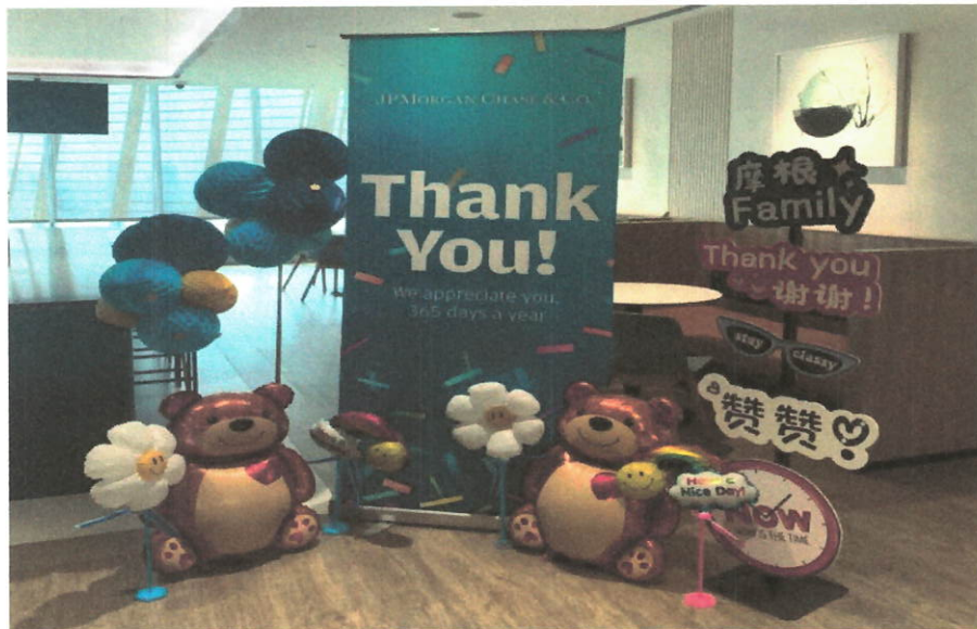
图六：举办健康展会（上海）